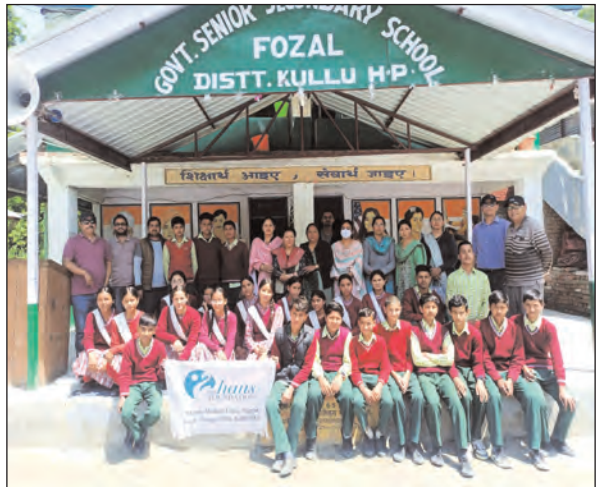
आयोजन किया, जिसमें अनीमिया के महत्व को बढ़ावा दिया गया।