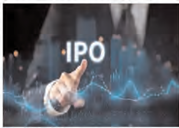
प्रॉस्पेक्टस (डीआरएचपी) बाजार नियामक सेबी के सामने पेश किया था। सैनस्टार प्लांट बेस्ड स्पेशल

एजेंसी नई दिल्ली। गुजरात के अहमदाबाद स्थित प्लांट बेस्ड स्पेशल प्रोडक्ट और सामग्री समाधान कंपनी सैनस्टार लिमिटेड जल्द ही घरेलू शेयर बाजार में अपना आरंभिक सार्वजनिक निगम (आईपीओ) लाएगी। कंपनी को इसके लिए बाजार नियामक भारतीय प्रतिभूति एवं विनियम बोर्ड (सेबी) से मंजूरी मिल गई है।